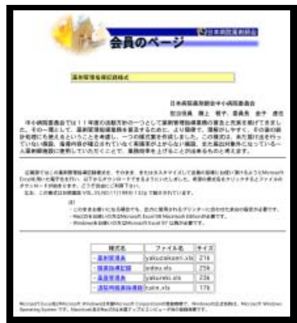
図1 日病薬ホームページでのダウンロード画面

勉強会の名称や具体的な日程等の詳細については、後日、対象となる施設の薬局へご連絡致しますので、ふるってご参加ください。